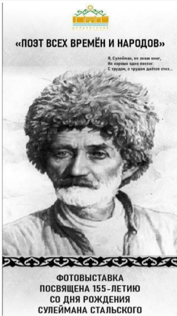
«ПОЭТ ВСЕХ ВРЕМЁН И НАРОДОВ»

10 сентября фотовыставка «Поэт всех времен и народов» была представлена в МБОУ «СОШ № 9 им. В.П. Сенченко».