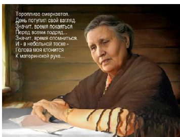
Торопливо смаркают. День потупил свой взгляд. Значит, время поплыть. Перла время поплыть. Значит, время оплохнеть. И - в небольшой толпе - слова моя скажут. К материнской руке...

Вспоминается случай из истории старушки-Европы. Графиня-мать обещала приговоренному к казни сыну непременно добиться у короля помилования. «Если я выйду в белом платье на балкон, выходящий на центральную площадь, - внушала мать сыну, - значит, король отменит казнь». На следующий день, стоя на эшафоте, окруженном шумной толпой звак, юноша в трепетном волнении и с большой надеждой вглядывался в фасад отцовского дворца. Когда палач наклонил ему плечо на шею, на балкон вышла радостная мать в белом платье, чем подбодрила его несказанно! Только на последнем проблеске сознания, когда петля туго затянулась на его шее и не давала уже дышать, он понял смысл материнского поступка: она не могла позволить своему сыну уронить мужество и