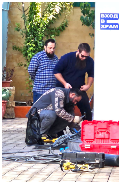
ВХОД В ХРАМ